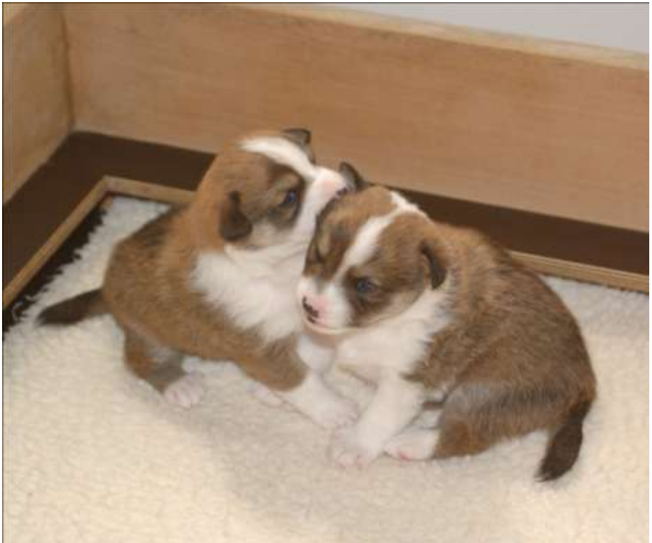
Skjold og Svalin

1 hann og 3 tisper etter Paluna's Sara Heradatter og Eriksro Køkar-Sune hos Liv Skjervik, Sandnes