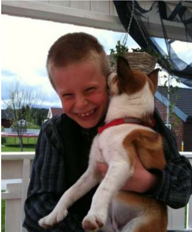
Odin og Villemo – Hvilke hemmeligheter deler disse to gode vennene da tro?