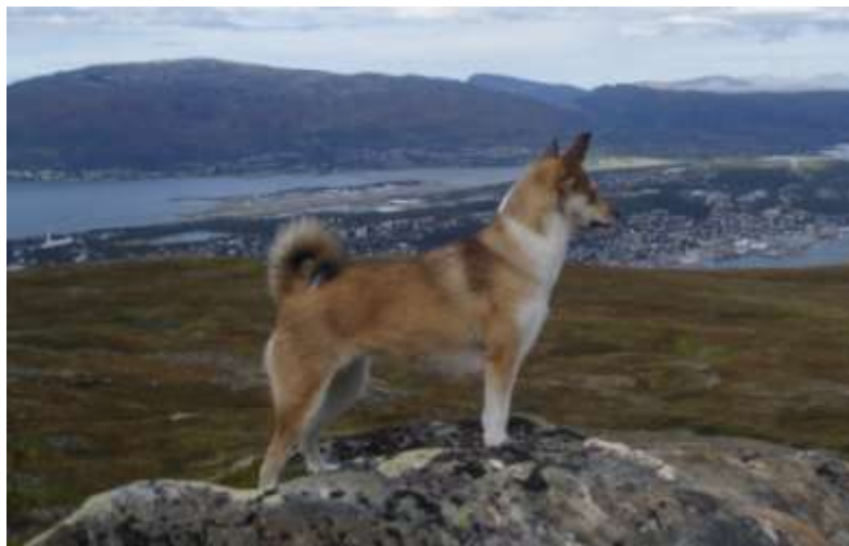
Frøya skuer ut over Tromsø