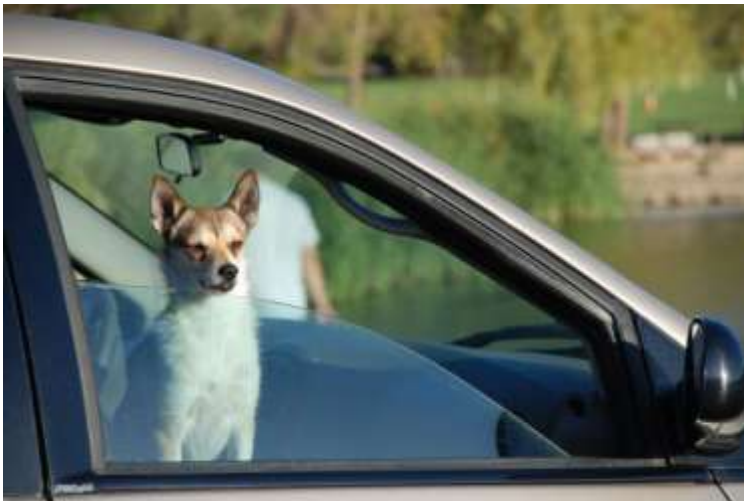
En fornøyd hund i en bil som ikke er for varm.