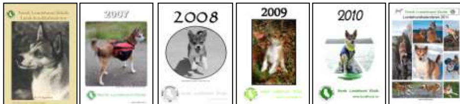
Tidligere års forsider. Fra 2006-2011.

Kalenderen for 2011 ble utsolgt, så hvis du er interessert i å sikre deg kalenderen for 2012 anbefaler vi å sende en forhåndsbestilling til samme e-postadresse.