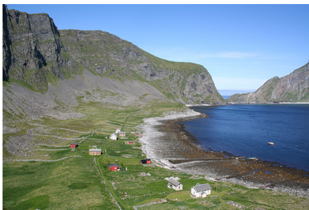
Måstad, Værøy