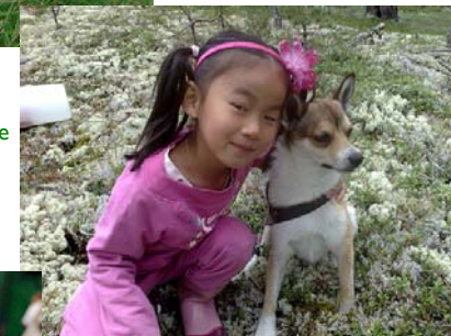
Chien de famille